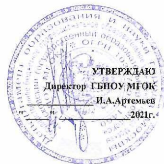
ГРАФИК НЕДЕЛЬ на 2 полугодие 2020-2021 учебного года