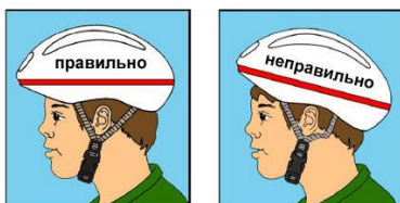
носите шлем на голове «под прямым углом»

Дети младшего возраста, попав в транспортный поток или проезжая перекрёсток, могут растеряться, потерять управление и попасть под колёса идущего рядом автомобиля. К тому же, большинство юных участников дорожного движения недостаточно хорошо знают ПДД, поэтому указанное ограничение возраста выбрано не случайно.